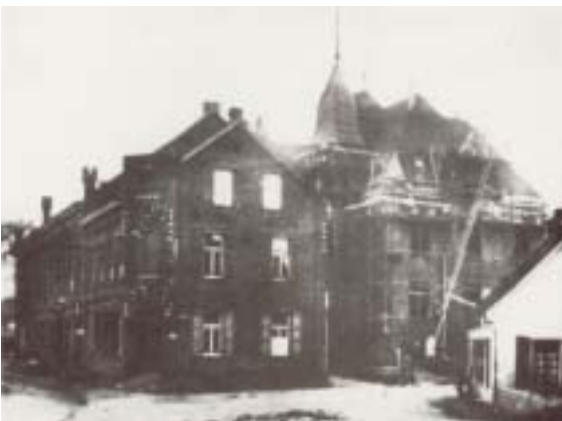
Bau des neuen Rathauses 1902