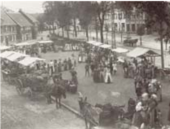
Marktszene um 1900

Die erste ordentliche Mitgliederversammlung wurde für die Woche darauf in einer Gaststätte festgelegt. Sie sollte in Zukunft monatlich stattfinden. Etwa 18 Monate später, kurz vor der Reichstagswahl im Juni 1903, war die Mitgliederzahl schon auf 150 angewachsen.