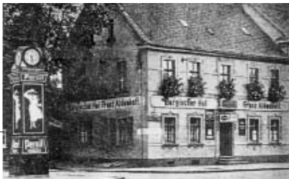
Gaststätte und Kino Aldenhoff. Häufiger SPD-Versammlungsort

Ende April 1926 gründete die SPD auch in Haan eine Ortsgruppe des Reichsbanners "Schwarz-Rot-Gold". Von den Besatzungsbehörden seit 1924 erlaubt, traten ihm zunächst viele Mitglieder bei. Im Januar 1927 blieben nur noch etwa 25 übrig. Es war eine staatsloyale, verfassungsstützende Massenorganisation, deren Kampf antirepublikanischen und antidemokratischen Parteien galt.