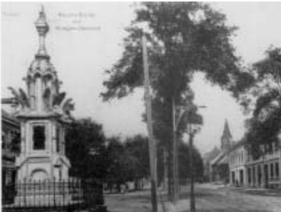
Das Kriegerdenkmal von 1887 in der Kaiserstraße

und Wilhelm Dittmann im Lokal Leimberg, Kaiserstraße 55, sowie im Hotel Windhövel im Januar 1912 bzw. im April 1913 in Parteiversammlungen, bereits nachdrücklich hingewiesen hatten.