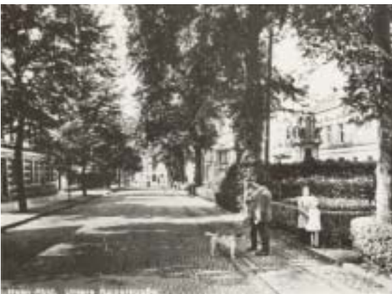
Kaiserstraße um 1900

Auf einer Mitgliederversammlung am 19. Oktober 1919 verfasste die Ortsgruppe einen Antrag an die Bezirksleitung, in dem sie dieser gegenüber mehr Selbständigkeit forderte. Außerdem beschloss sie mit knapper Mehrheit, sich der Kreisleitung Solingen anzuschließen.