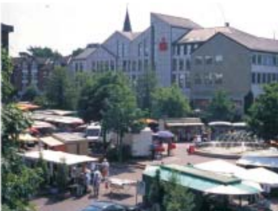
Wochenmarkt auf dem Neuen Markt