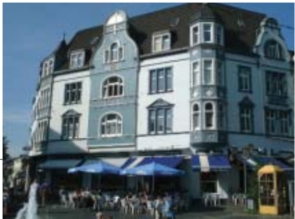
Alter Markt und Eingang Friedrichstraße

Nach dieser weiteren Steigerung des Wähleranteils nahm allerdings, wie beinahe überall im Wahlkreis, die Zahl der Mitglieder leicht auf etwa 120 (Stand Juli 1908) ab. Ebenso verlor die Parteipresse Abonnenten. Die Parteiführung erklärte dieses "Zwischentief" mit einer Ende 1907 einsetzenden Wirtschaftsflaute.