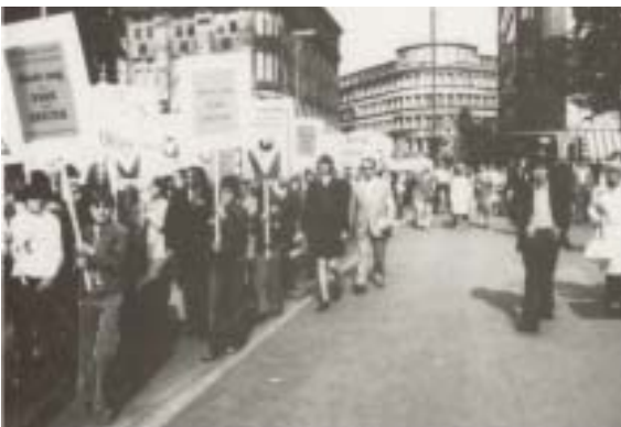
Protest in Düsseldorf am 25.5.1974 gegen die Eingemeindung nach Solingen

stritten sie für ein neues Jugendhaus und für den ersten Kinderhort in Haan. Die Wahlkämpfe 1984, 1989 und 1994 wurden von ihnen maßgeblich geprägt.