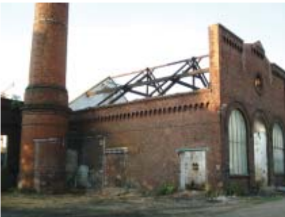
Ruine der Weberei Besenbruch